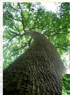
Chêne de l'école

L'aménagement en cours de révision couvrira la période 2008 - 2027